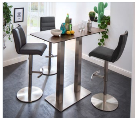
Bartisch ZARINA 3 mit Barstuhl GIULIA