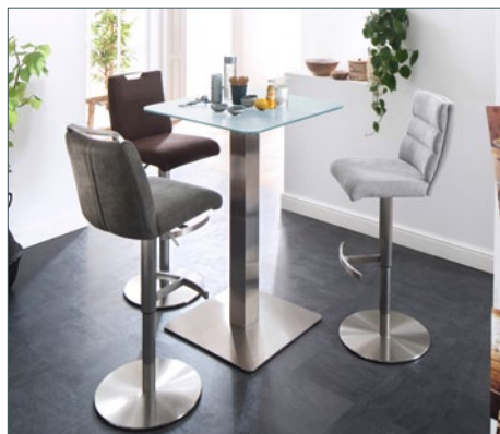
Bartisch ZARINA 2 mit Barstuhl GIULIA