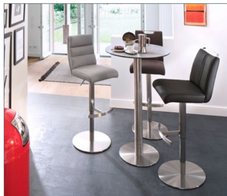
Bartisch ZARINA 1 mit Barstuhl GIULIA