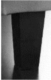
Fu G 18cm hoch Holz (Buche )