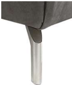
Fu F12 18cm hoch Metall poliert oder satiniert