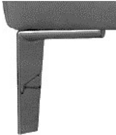
Fu F11 18cm hoch Alu poliert