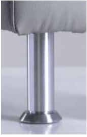
Fu C 18cm hoch Alu gebrstet